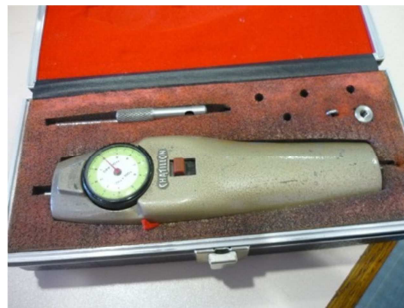
Calibrador de fuerzas 5Kg CHATILLON DDP-5Kg Ref: MMUS-64