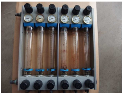
Caudalimetro 6 zonas. COMERCIAL MARSE WFR 6 Z/S Ref: 17515