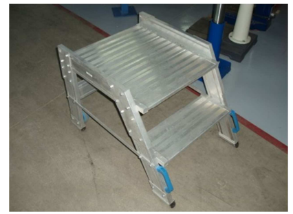
Plataforma de trabajo homologada 2 peldaños ESLA GRADILLA 45 GRADOS Ref: ESLA-1