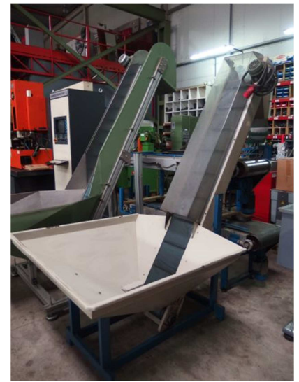
Cinta tolva elevadora 2000x240 mm TAD TE-04 Ref: 17380