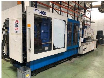
Inyectora termoplástico 460 ton. PROTECNOS PTN-460 PREMIUM Ref: 200194