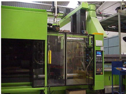
Inyectora termoplástico 450 ton. Robot Engel ERC ENGEL ES 7050/450 H K TM Ref: 200192

Les enviamos nuestro Boletín de esta segunda quincena mes de Mayo con 21 productos con novedades de inyección termoplástico y maquinas en oferta de metal y plástico con descuentos de hasta el 50%. Esta oferta dura hasta final mes de Mayo. El embalaje en palet o caja tiene un coste de 10 euros, si son máquinas de grandes dimensiones es a granel. Los portes son debidos. Pueden hacer sus compras a través de nuestra web o directamente por teléfono.