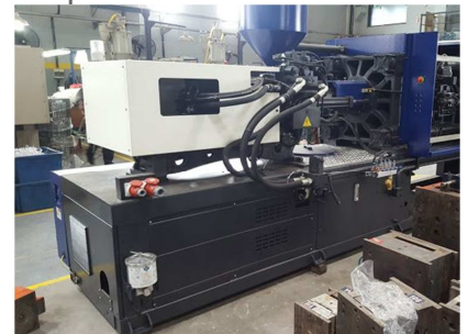
Inyectora termoplástico 450 ton. HAITIAN HTF 450X SE Ref: 200195