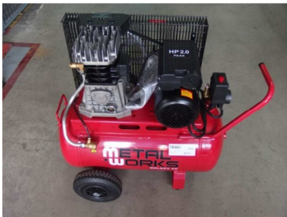
Compresor de pistón portátil 1.5 Kw. METALWORKS Galaxy 50 Ref: ASL-4585002 (16994,16467)