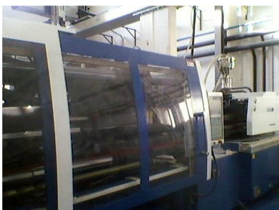
Inyectora termoplástico 210 ton. PROTECNOS PTX 210 Ref: 200196