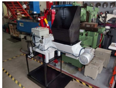
Molino compacto autoalimentado 1.9 kw MATEU&SOLE 15/21 M 2 S15 Ref: 16743