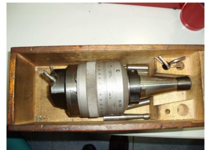
Cabezal de mandrinado micrométrico ISO 40 CRUCELEGUI HERMANOS D- 210 Ref: 15196