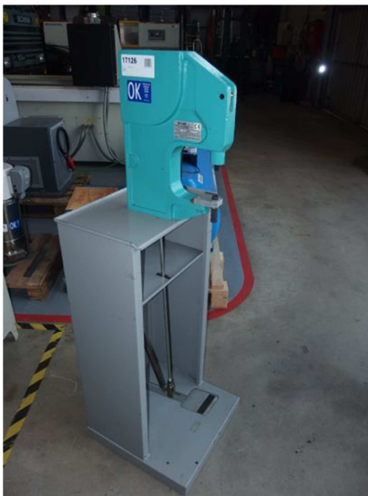
Prensa manual 400 DN (kg) SICOM SRL MSE-MN Ref: 17126