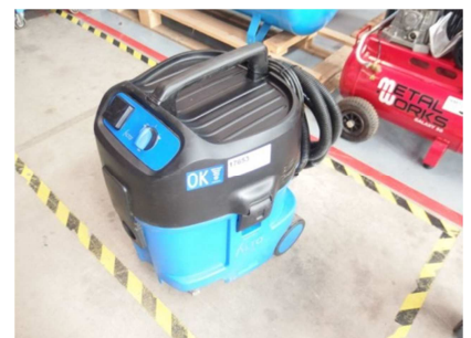
Aspirador para máquina portátil 3600 watos. ALTO ATTIX 550-21 Ref: 17653