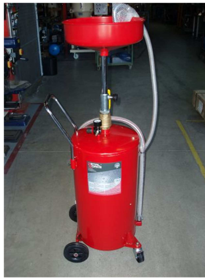
Recuperador de aceite 68 litros. METALWORKS OD68 Ref: ASL-724561001 (16317)