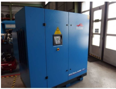
Compresor de tornillo 55 kw. WORTHINGTON CREYSSENSAC ROLLAIR RLR 75A Ref: 17652