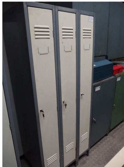
Taquilla vestuario 3 puertas RONEO 3 Puertas. Ref: TV24V