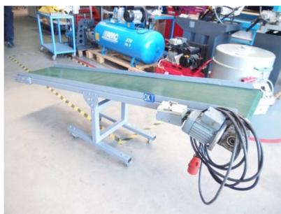
Cinta transportadora plana inclinable 2200x400 mm. RODANT BE 06 Ref: 17619