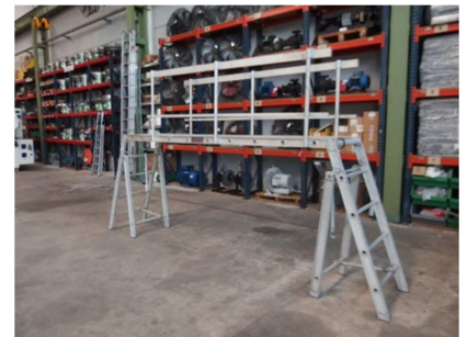
Andamio aluminio 2700 mm. EOPSA ALUDAMIO Ref: EOPSA-2