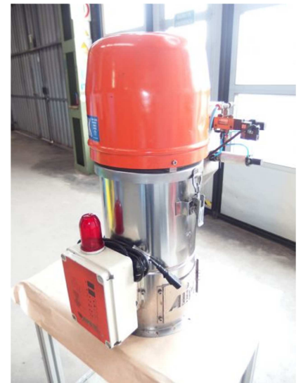
Cargador monofásico 50 kgs/hora. ALIMATIC A-5+VM-40 Ref: 17527