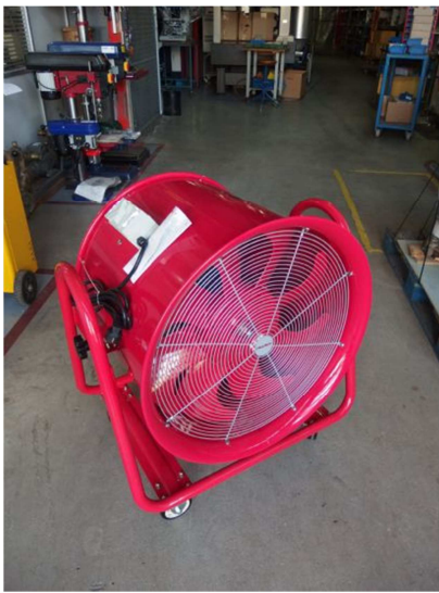
Ventilador 600 m/m METALWORKS MV 600 SL Ref: ASL-722313510 (16464)